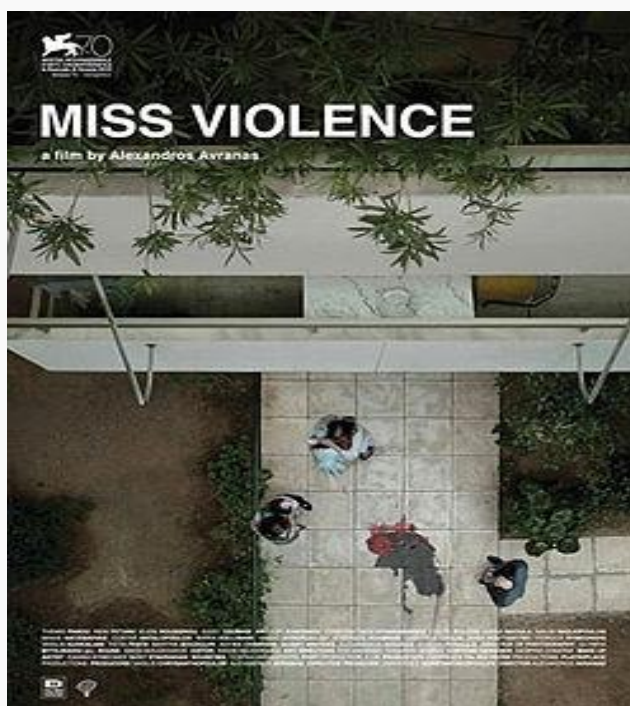
Κινηματογραφική αφίσα της ταινίας